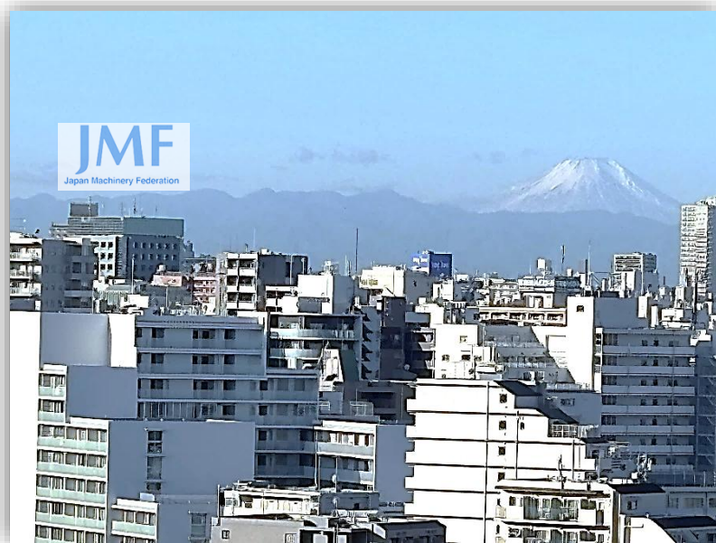
高田馬場センタービル(左上)と富士山