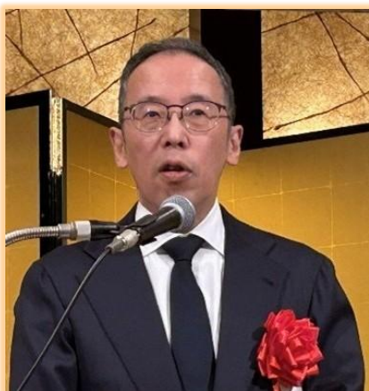
信谷和重近畿経済産業局長 来賓挨拶