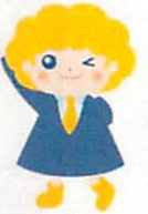
パートタイム・有期雇用労働法 キャラクター「ハルちゃん」