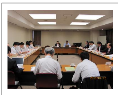
ロボット大賞審査・運営委員会

調査研究活動の成果を「調査研究報告書」にまとめ、700部を印刷してロボット関係者に配布した。また、日本機械工業連合会HPに掲載した。