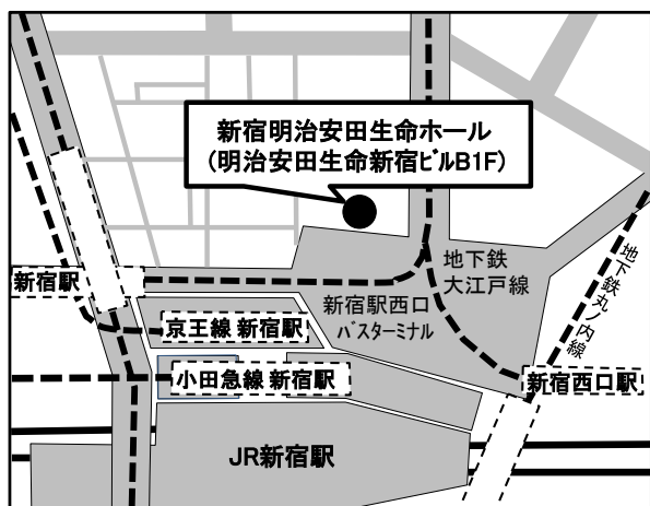
《新宿駅西口周辺マップ》