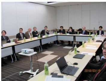
開発部会・会議風景

また、機械安全普及に係る講演会「機械安全国際規格の紹介」－ISOに基づいた安全な生産システムの構築、及びIECにおけるセキュリティの標準化－、及びISO/ IEC国際標準に準拠した機械安全講習会を実施した。