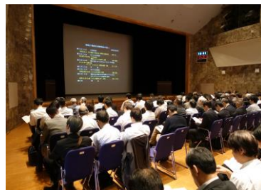
講演会・聴講風景