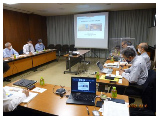
テーマ別検討会の開催模様